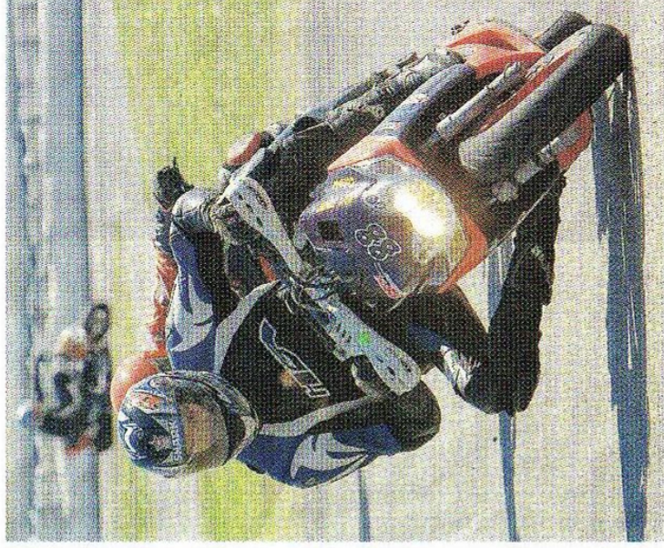
Les 24h de scooter ont permis un joli spectacle.

Ce fut donc un beau week-end de motos même si Max Tropez, amer après son abandon sur une chute pendant la 4 e manche, était déçu du faible nombre de participants.