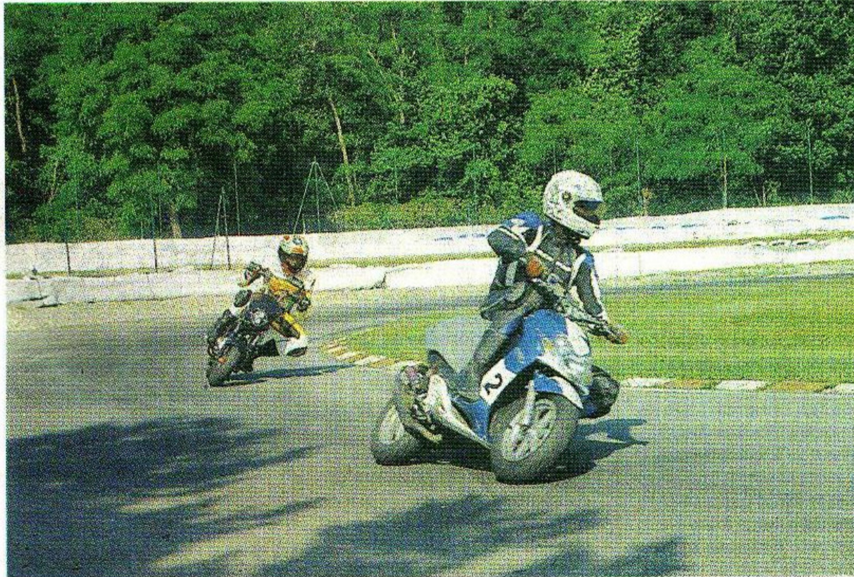
Les 24h de scooter: ce week-end sur le circuit de Biesheim.

24H DE SCOOTER. CIRCUIT DE BIESHEIM. SAMEDI. Début d'après-midi et jusqu'à 15h: 3 manches de super-motard. 15h: départ des 24h de scooter. DI-MANCHE. 15h: fin de la course des scooters, suivi par le super-motard (3 manches + finales à l'américaine)