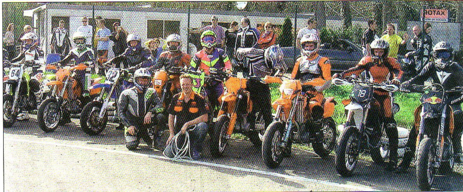
Les épreuves se dérouleront sur la piste de kart à Biesheim ce week-end.