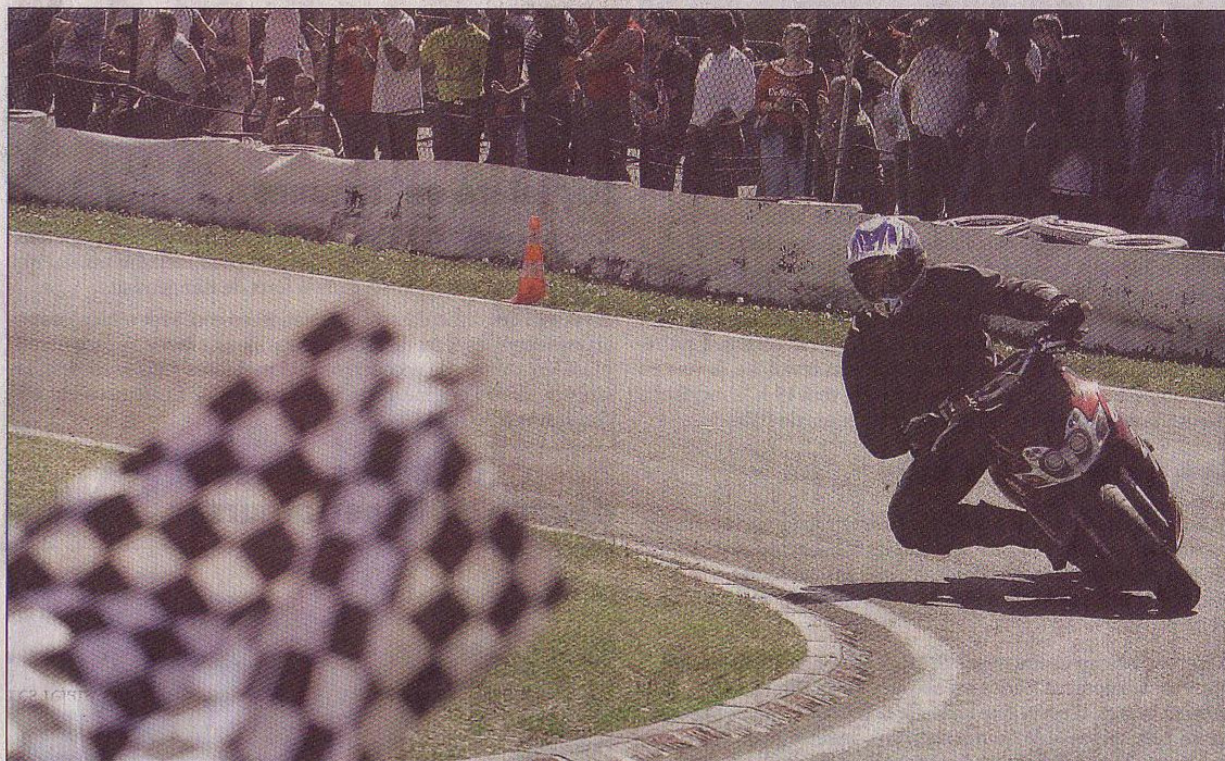
Avec le numéro 20, le team « Conduite Eugène » avait avalé 2050 tours de piste à l'arrivée.